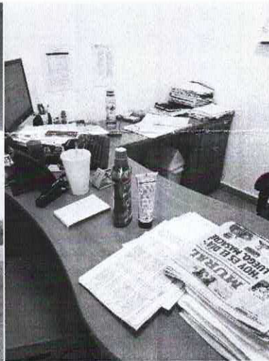
ENTREGA MEDICAMENTO 100 CORAZONES