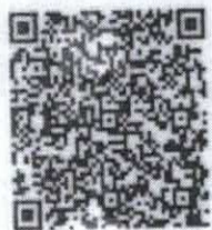
firma del profesionalista

Cumplió con todos los requisitos que marca la Ley para el Ejercicio de las Actividades Profesionales del Estado de Jalisco.