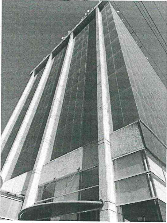
Edificio Ciudad Niñez (Juzgado Familiar Especializado en NNA)