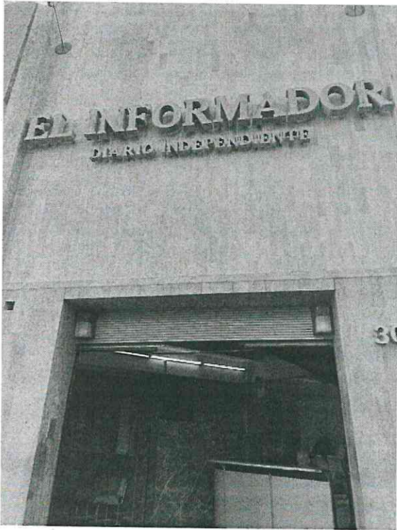
Periodico El Informador