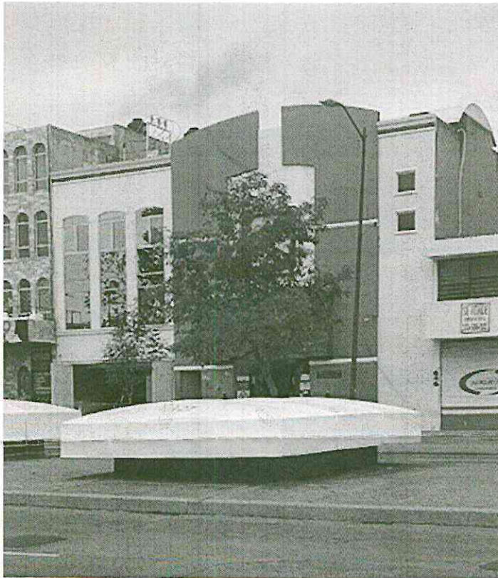
Fotografía ¡Error! No hay texto con el estilo especificado en el documento.-1 Exterior Funeraria Latinoamericana, calzada Federalismo No. 1485, Col. Mezquitán