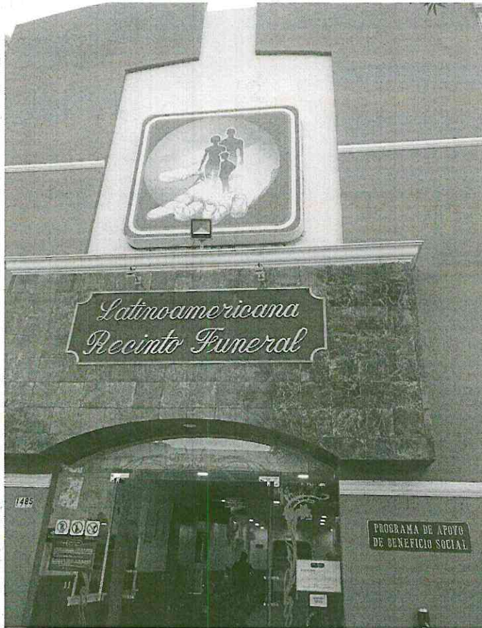
Ilustración 1 Exterior Funeraria Latinoamericana, ciudad de Guadalajara, Jalisco

Anexo. Destino de traslado de Sistema DIF a Funeraria Latinoamericana, martes 22 de abril del 2025