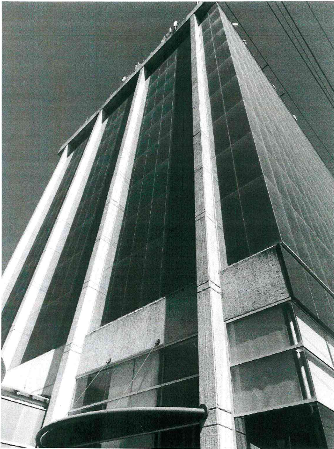
Edificio Ciudad Niñez (Juzgado Familiar Especializado en NNA)