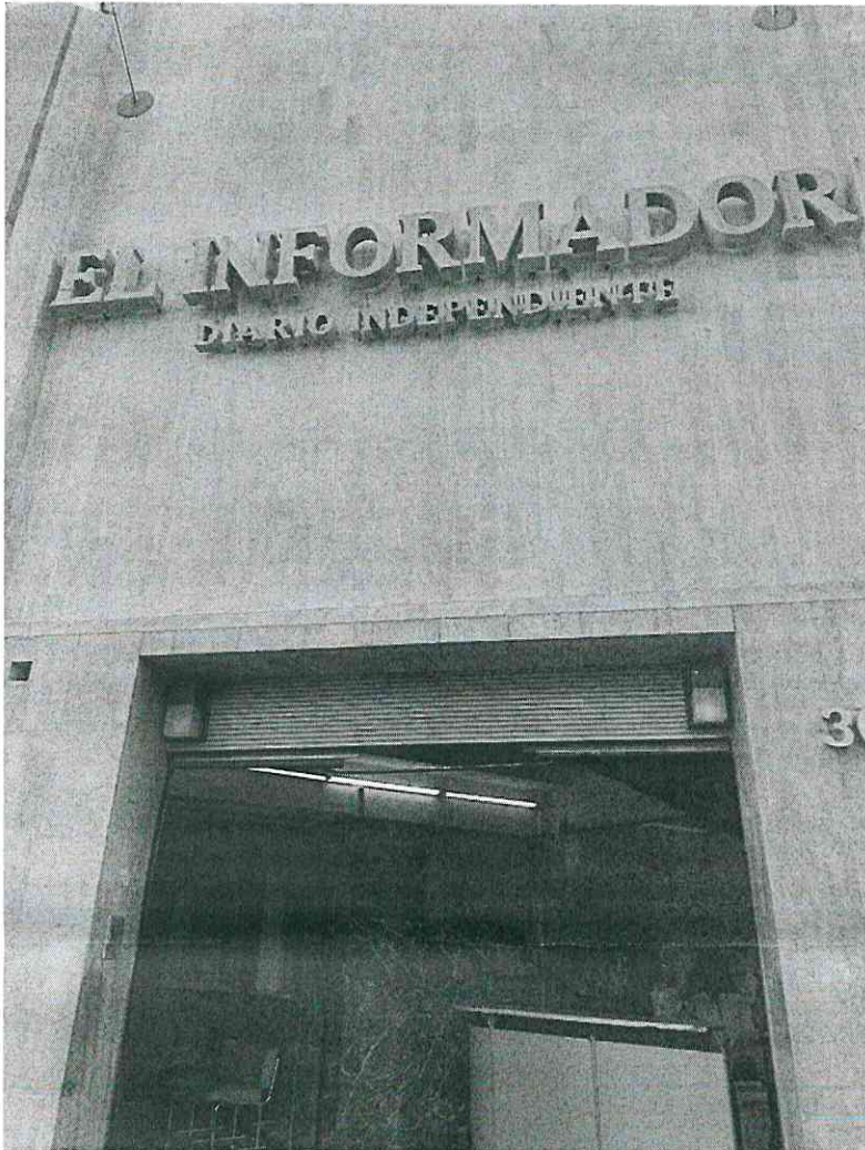
Periódico "El Informador"