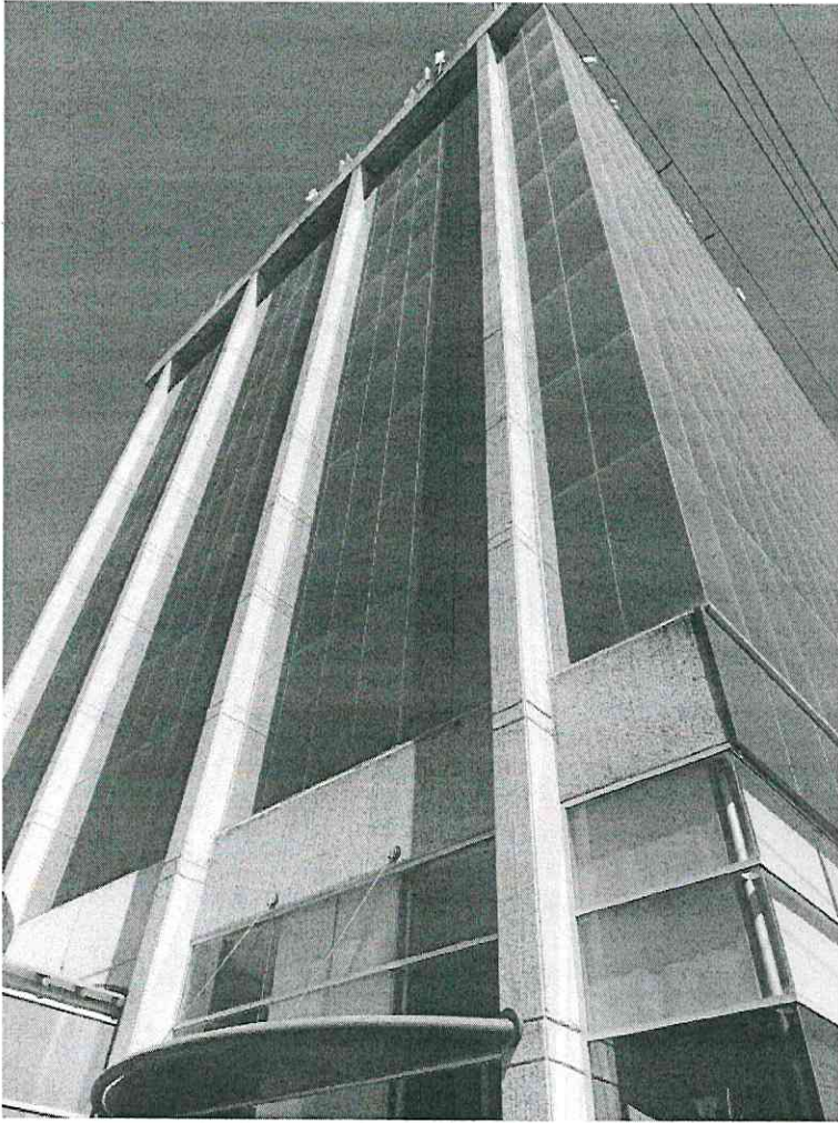
Edificio Ciudad Niñez (Juzgado Familiar NNA)