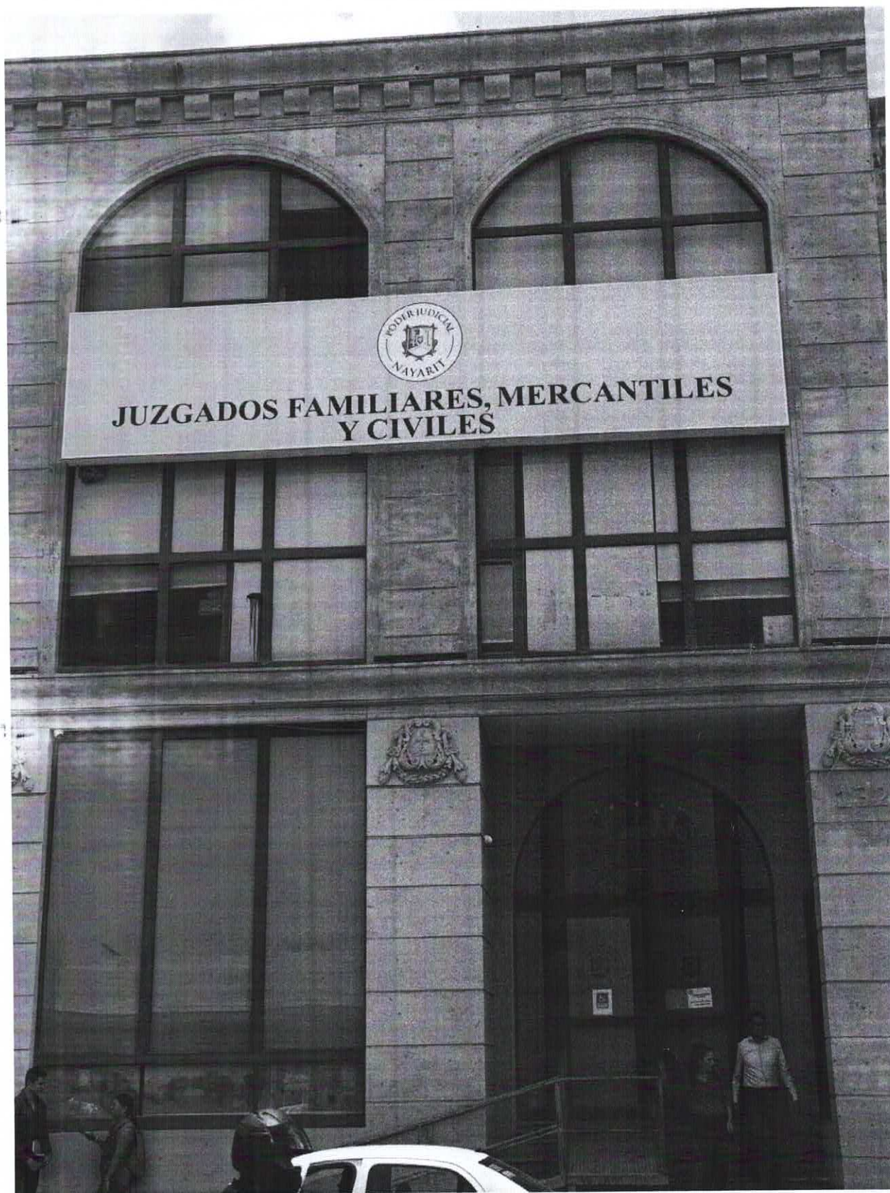
Juzgados Familiares de Primera Instancia de Tepic, Nayarit.